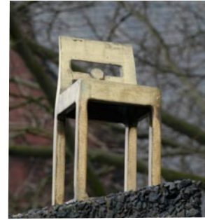
Der Stuhl des Chefredakteur Karl Marx

„Der Stuhl des Chefredakteur Karl Marx“ wurde im Dezember 2006 vom Verein Kassel-West e.V. mit Hilfe von Spendengeldern aus der Bevölkerung angekauft, um es dauerhaft an dem Standort Karl-Marx-Platz zu sichern.