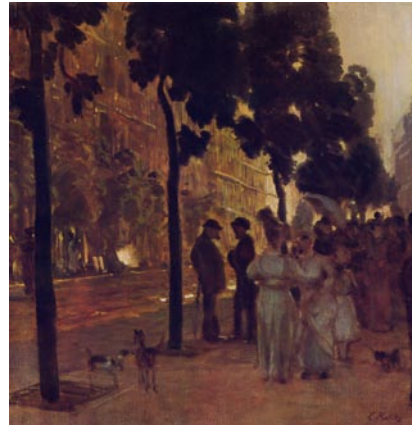
Louis Kolitz: Die Hohenzollernstraße (heute Friedrich-Ebert-Straße) bei Sonnenuntergang

Der Verein fördert und vernetzt die Aktivitäten im Stadtteil im Bereich Kunst, Kultur, Stadtteilentwicklung und Stadtteilgeschichte. Durch Stadtteilkonferenzen, Internetportal und Veröffentlichungen wird die Kommunikation im Stadtteil unterstützt.