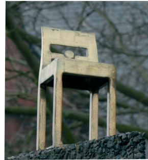
Der Stuhl des Chefredakteur Karl Marx

„Der Stuhl des Chefredakteur Karl Marx“ wurde im Dezember 2006 vom Verein Kassel-West e.V. mit Hilfe von Spendengeldern aus der Bevölkerung angekauft, um ihn dauerhaft an dem Standort Karl-Marx-Platz zu sichern.