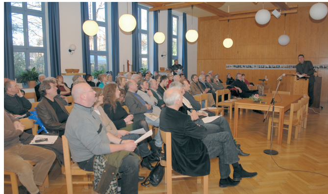
Stadtteilkonferenz zur Friedrich-Ebert-Straße

Ziele des Vereins sind die Förderung und die Vernetzung von Aktivitäten im Stadtteil in den Bereichen Kunst, Kultur, Stadtteilentwicklung und Stadtteilgeschichte. Durch Stadtteilkonferenzen, Internetportal und Veröffentlichungen wird die Kommunikation im Stadtteil unterstützt.