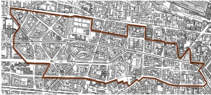
Programmgebiet der Aktiven Kernbereiche

Dieses Beteiligungsverfahren ist vom Land Hessen auch vorgeschrieben. Schon seit Jahren gibt es den Runden Tisch Friedrich-Ebert-Straße, der von den Ortsbeiräten Vorderer West und Mitte initiiert wurde und in dem auch Vertreter von Kassel-West mitarbeiten.