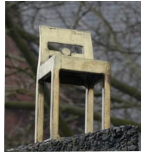
Der Stuhl des Chefredakteur Karl Marx

„Der Stuhl des Chefredakteur Karl Marx“ wurde im Dezember 2006 vom Verein Kassel-West e.V. mit Hilfe von Spendengeldern aus der Bevölkerung angekauft, um ihn dauerhaft an dem Standort Karl-Marx-Platz zu sichern.