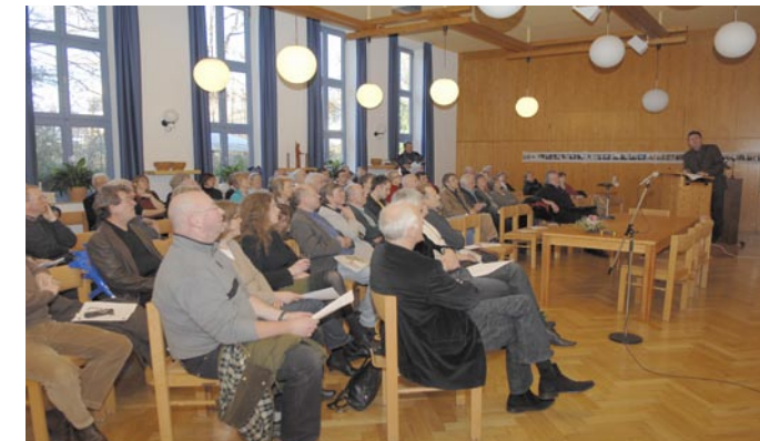
Stadtteilkonferenz zur Friedrich-Ebert-Straße

Im November 2005 hat sich der Verein „Kassel-West - Stadtteilentwicklung im Vorderen Westen e.V.“, abgekürzt „Kassel-West e.V.“ gegründet.